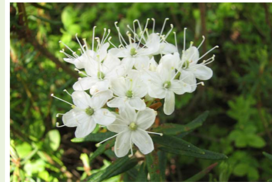
Ledum palustre, NPR Červené blato, CHKO Třeboňsko