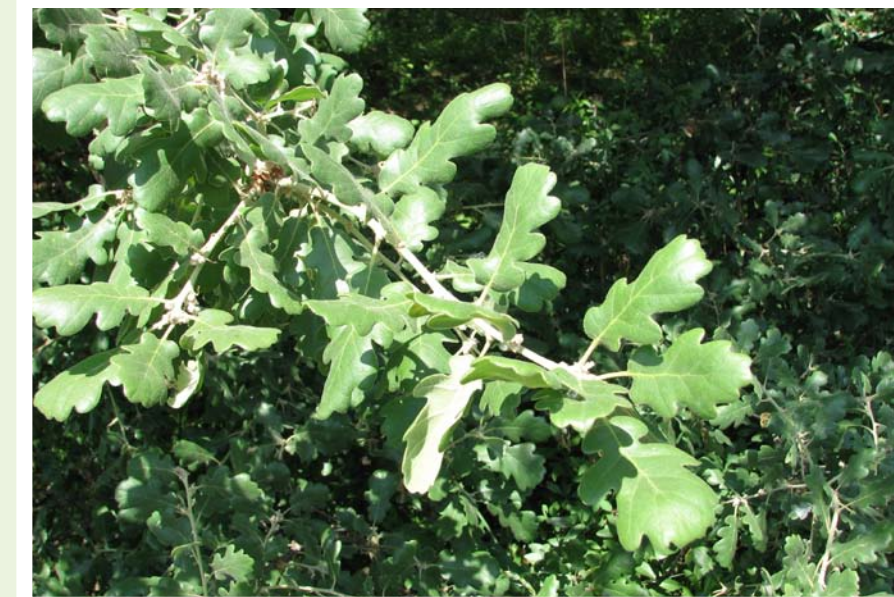
Quercus pubescens, PR Velká Kobylanka u Hranic