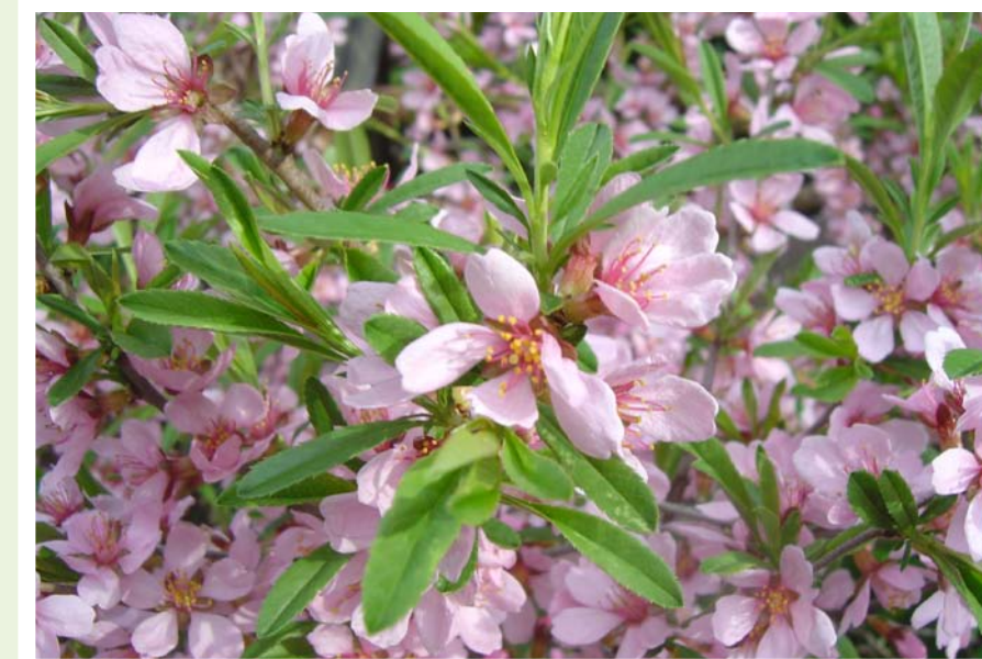
Amygdalus nana, BZA Mendlu Brno